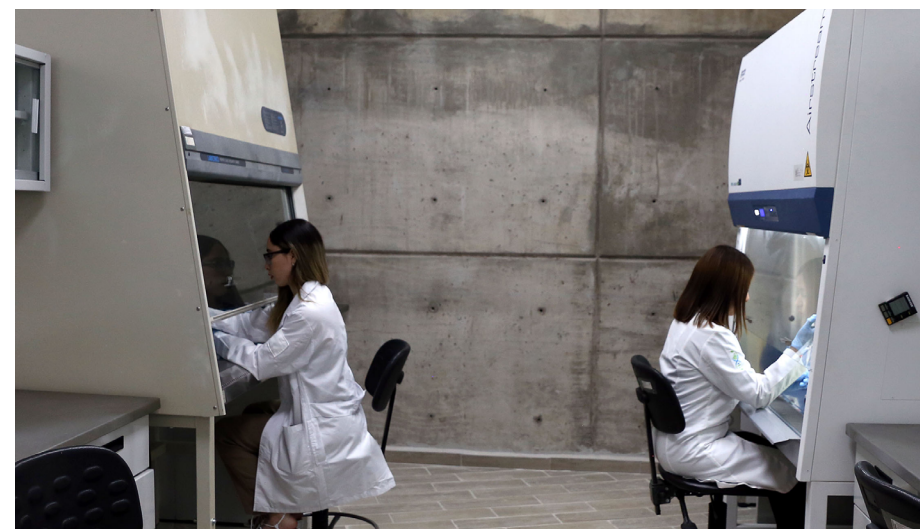
Kemeyipaimeti SNII me'aye'uuti memiteparewewie PROSNII, 'iiki ta'uuximayátsikatsie mepuyutimiiiritia 76.5% 'iniarimeki.

2024 wiitaari tsie, pu'iniatsie 570 paimeme 'ikitiarika 'uuximayataame waxeiriya tiyuteriwati Cuerpos Académicos (CA), tsiere 24% paimeti tatsiari (137) 'iniariti 'etsiwatikaku 'aixi peuti'anene (CAC), 34% (194) paimeti hirixia paye'atika (CAEC) metá 41.9% (239) paimeti 'aixi 'akuxi piyutiuruwa (CAEF). Katsutiti 2019 'uti'akameki 2024 wiitaari, te'uximayatamete 'iiki tsie emaye'u tatsiari CA waikáwa mepiti'irixi 2.5%, tatsiari 2,537 mipaimekai, 'imatirieka matia 2,601. 'Imatirieka haika wiitaari manuyetia (2022-2024) paka'utia 1,641 paimeme 'uuximayátsika 'utiarikayari muyutiwewi CA hepaitisita mieme.