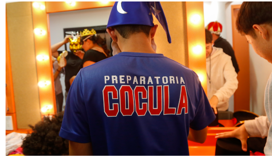
Huuta wiyari 'uyuweyatí puyutiwewi 277 yeiya CCU Tu lugar tiyuteriwati, maana 8,235 teyi'ikitiwaamete mekakumaritsiariarie yeiyari kite kemitiu'utika.

tewakame Premio Travellers' Choice 2020 waana mayemie TripAdvisor, maana kaniuhuritarieni 10% kemayeyewa miikitsie plataforma.