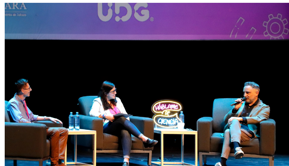
Podcast Háblame de Ciencia, mi ri Ciencia UDG metá mitiyutiniitixi The Conversation Group hamatia, miiki yapaimeti panuyetei makina maiyá muyuyeweyi waikáwa mirahekiatiwa, CGIPV metenuiwitsitiakaku.

wiitaari meutiparixi tsie, xapate maiyakáme-ki mewewiya UdeG mieme pana-yenetiarie hekiapa 24 metá tipaime 64 tepiatsie mayehú; 'iiki 18 paimeti xapate teriwariwaame piyuka'uitia 'aixuwimeriekatsie waiká makumatiwa maitiari-katsie naitсарie kwie keminena yutaxexeyati.