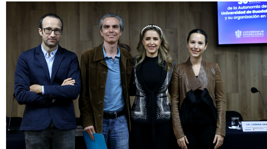
Te'ikitaamete hauriwekamepa titewakame Ciencias Ambientales y del Territorio memuhaaxime CUTLAJOMULCO.

reti 10,759 (61.9%) me'iniariti xexuime ya yapaimeme xeikia asignaturas mepi'ikita xeikia, wa'itima mepeti'ú naimimeki xei tuukari kemireuteteret-sie maiyá yeikiya memayexeiya 2,650 (15.2%), wa'itia mepahekia te'iki-taame xei tuukari kemireutetere ya memite'ikita 2,031 (11.6%) meyupaimeti. 'Iiki administración me'aye'ukaku kaniyutiwewieni 14 Xapa 'inierika miwaruparewi me yu 18,734 te'uuximayatamete. 'Iiki'i yamipaimekai xapa 'inierika, 8 paimeti kaniyukuxataikaitini kename mewaparewieka te'uuximayatamete memiteyi'ikitiakaki, yapita tsiere 6 ti paimekai xapa 'inierika 'uuximayátsika 'aixi 'aneti mayuyexeyaniki metá parekumeki memi'iwiyariekaki.