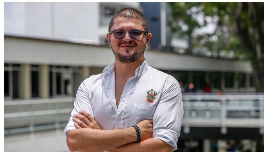
Ya tewimeki ta'uximayátsikatsie panuyuyetúa 23 'inierika maitiárikatsie te'uximayataame wahetsie mieme, maana'i 11,339 te'uximayataame mepite'unakitsitia.

Hauri Weekamepa putahayewaxi mitiutaheekwariyáxi Plan de Desarrollo Institucional 2019-2025, Visión 2030, y los planes de Desarrollo de los Centros y Sistemas mititewá, katiniupareewieni tsi Hauri Weekamepa Witsariéya. Plan de Desarrollo Institucional (PDI) punirie 29 marzo 2023 wiitaarisie Honorable Consejo General Universitario (HCGU) wahixie.