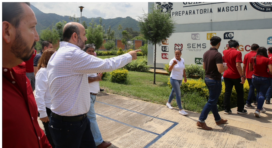
'Ataxewi wiitaari matiyune UdeG piyetua $5,831 millones de pesos reuyeta paimeme kimana 2,535 paimeti kite mitiyutiwewieniki naitsarie Hauriwekámepa Witsaritsie.

51,748 teyu'íkitiwaamete hekwamete me'utixuawerixi 6 wiitaari 'anuyeyaku 'eena Hauriwekámepa witsarieya.